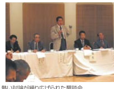
熱い討論が繰り広げられた懇談会