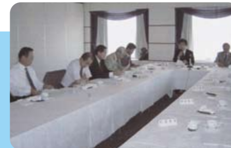
(社)全国中小建設業協会建築委員会