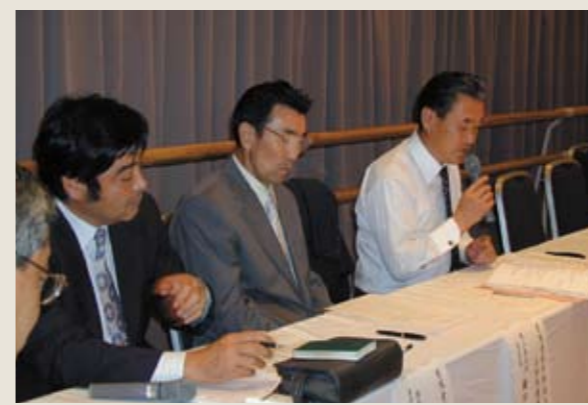
▲全委員会の協力の下、開催された専門業者懇談会