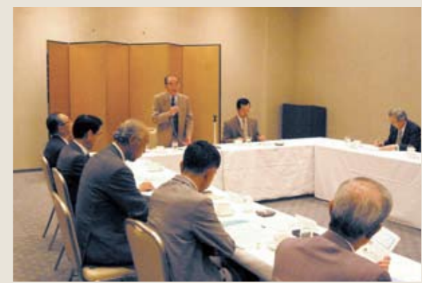
▲調査研究委員会を中心となって開催した「大いに語ろう」