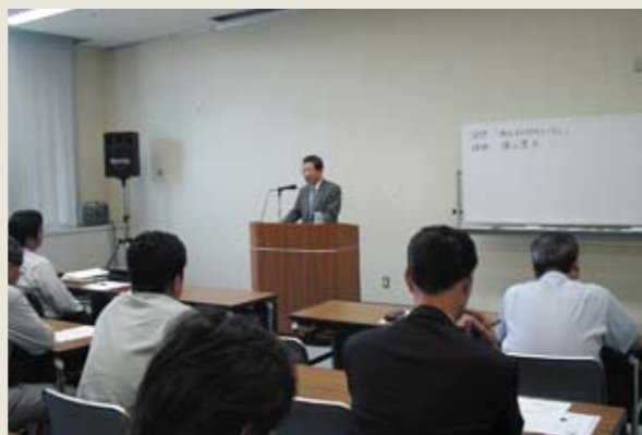
▲施工委員会が中心となって開催した第1回研修会