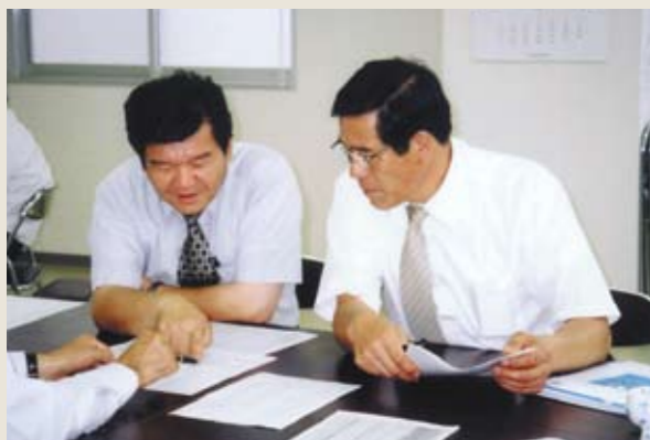
▲総務委員会会員拡大大会